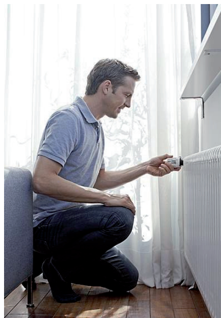
Senkung des Energieverbrauchs durch Verhaltensänderung, Quelle: http://www.bewusst-heizen.de , 2013

halten die Möglichkeit, ihr Heizverhalten über einen speziellen Zähler, der die Ener-